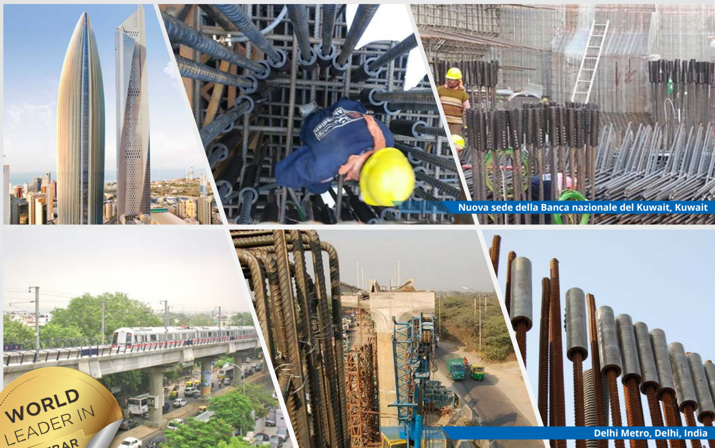
Nuova sede della Banca nazionale del Kuwait, Kuwait